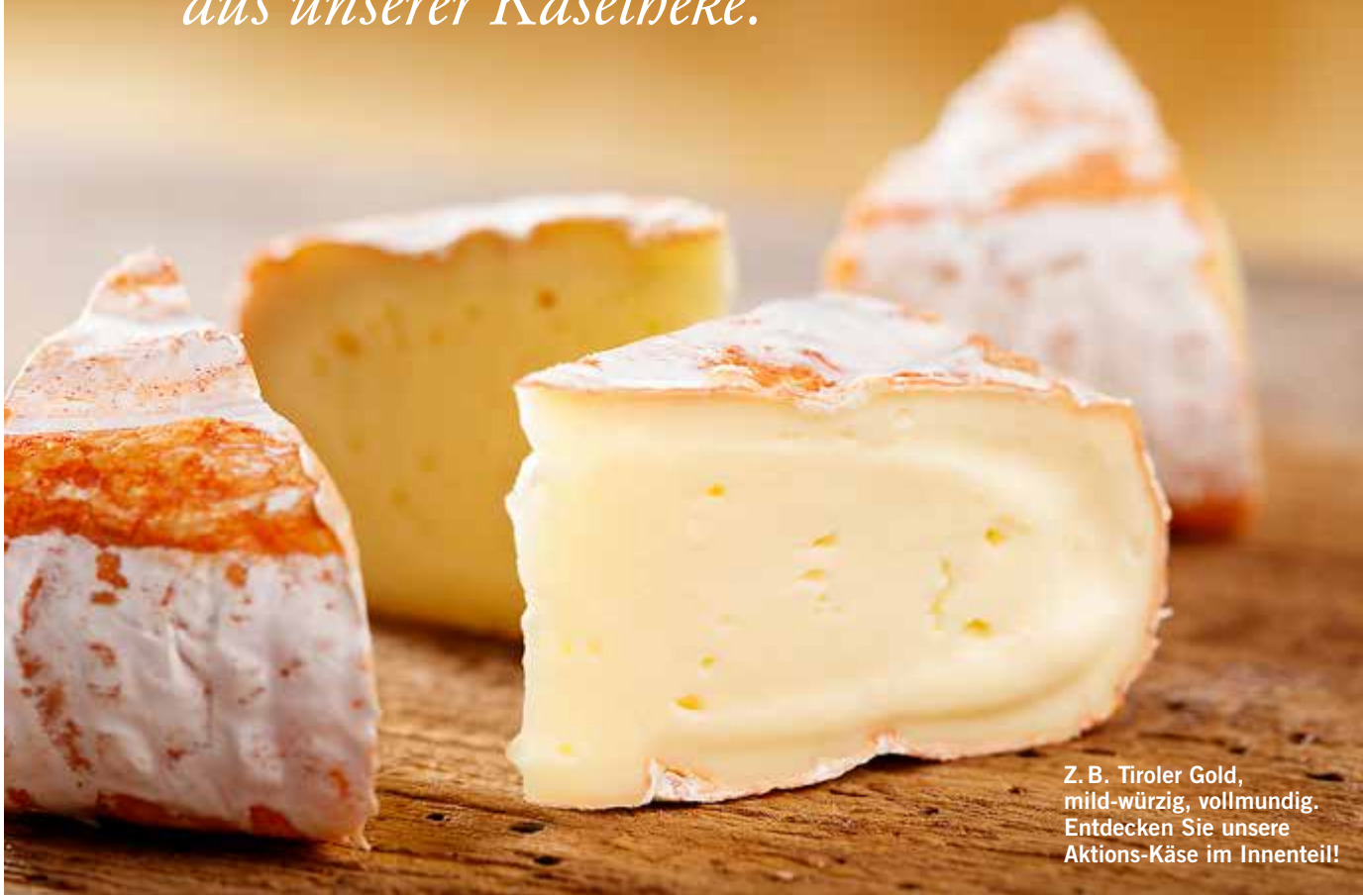
Z. B. Tiroler Gold, mild-würzig, vollmundig. Entdecken Sie unsere Aktions-Käse im Innenteil!